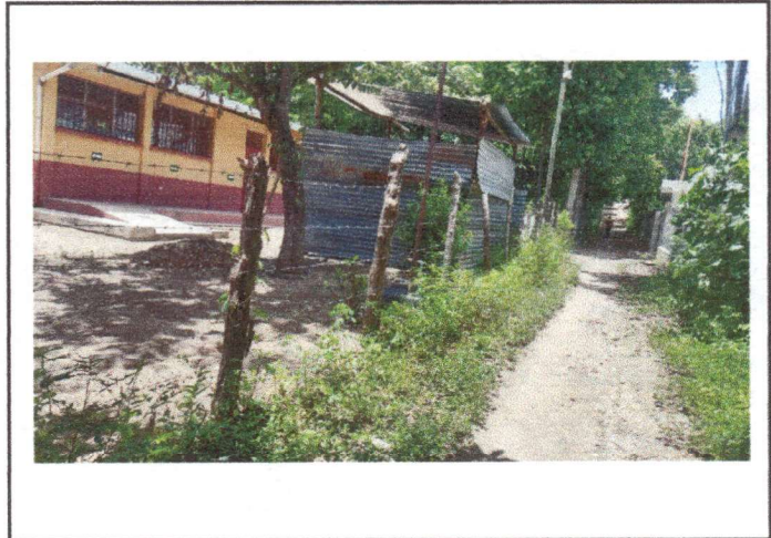
Foto 1: AREA DONDE SE CONTEMPLA HACER EL MEJORAMIENTO DE CERRAMIENTO DEL MURO PERIMETRAL.