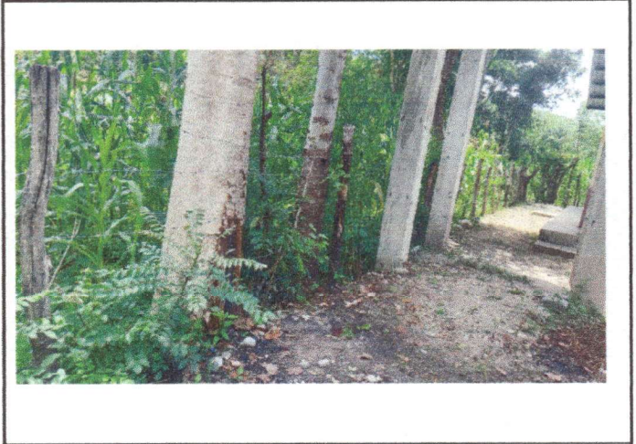
Foto 2: OTRO ANGULO DEL AREA DONDE SE CONTEMPLA HACER EL MEJORAMIENTO DE CERRAMIENTO DEL MURO PERIMETRAL.